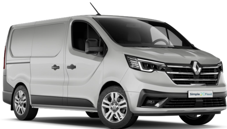
Bilder können von der tatsächlichen Ausstattung abweichen