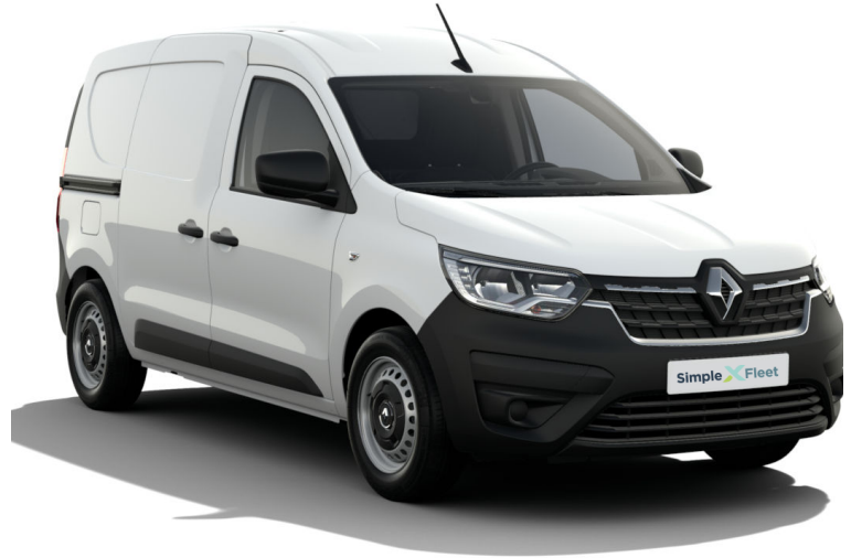
Bilder können von der tatsächlichen Ausstattung abweichen